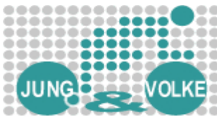
Zweiradstudio Jahnstr. 22-24